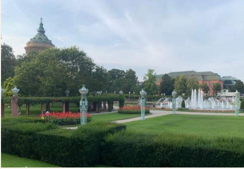
Wasserturm / Water Tower, Friedrichsplatz, Mannheim