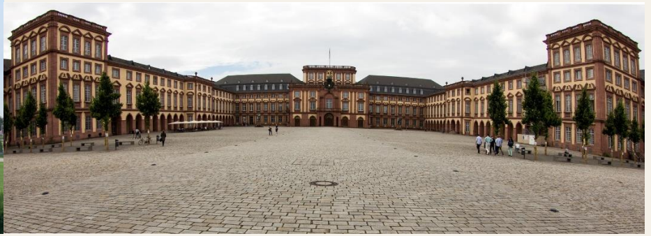
Schloss / castle of Mannheim