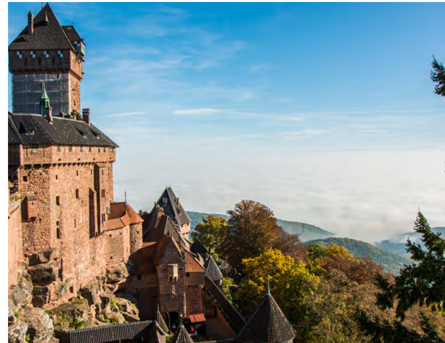
Abb. 4: Hohkönigsburg im Elsass

Bei der Springschool werden die thematischen Einheiten von einer Präsentation der Vorgehensweisen in den beteiligten Projekten eingeleitet, die anschließend von den Teilnehmer*innen an konkreten Beispielen eingeübt werden. Zum Programm gehören außerdem Exkursionen zu historischen Stätten in Freiburg und zur Hohkönigsburg im Elsass, um eine unmittelbare Begegnung mit den Objekten und den Austausch vor Ort zu ermöglichen.