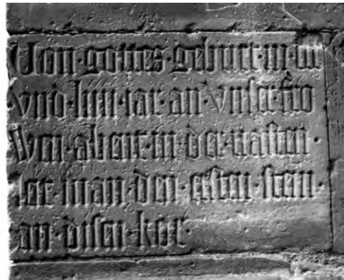
Abb. 3: Bauinschrift am Freiburger Münsterchor

bildenden Kunst bleibt die Wertschätzung mittelalterlicher Werke das gesamte 19. Jahrhundert über prägend. Zahllose »Alterthümer« werden damals wiederentdeckt und in den Dienst eines idealisierten Mittelalterbildes gestellt. Eine wichtige Rolle nimmt hierbei auch die Auseinandersetzung mit den historischen Vorbildern ein, die den Künstlern jener Epoche den Vorwurf des unschöpferischen Eklektizismus eingebracht hat. Die Instandsetzung schadhafter Kunstwerke im Geist des Historismus lässt die Grenzen zwischen Original und Neuschöpfung verschwimmen, womit letztlich auch die Fragen der Authentizität berührt werden.