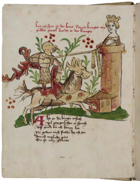
Abb. 2: Donaueschinger Wigalois

Dazu zählt etwa der Beginn der systematischen Erschließung mittelalterlicher Rechtsquellen ebenso wie die »Entdeckung« mittelhochdeutscher Literatur. Im Bereich der