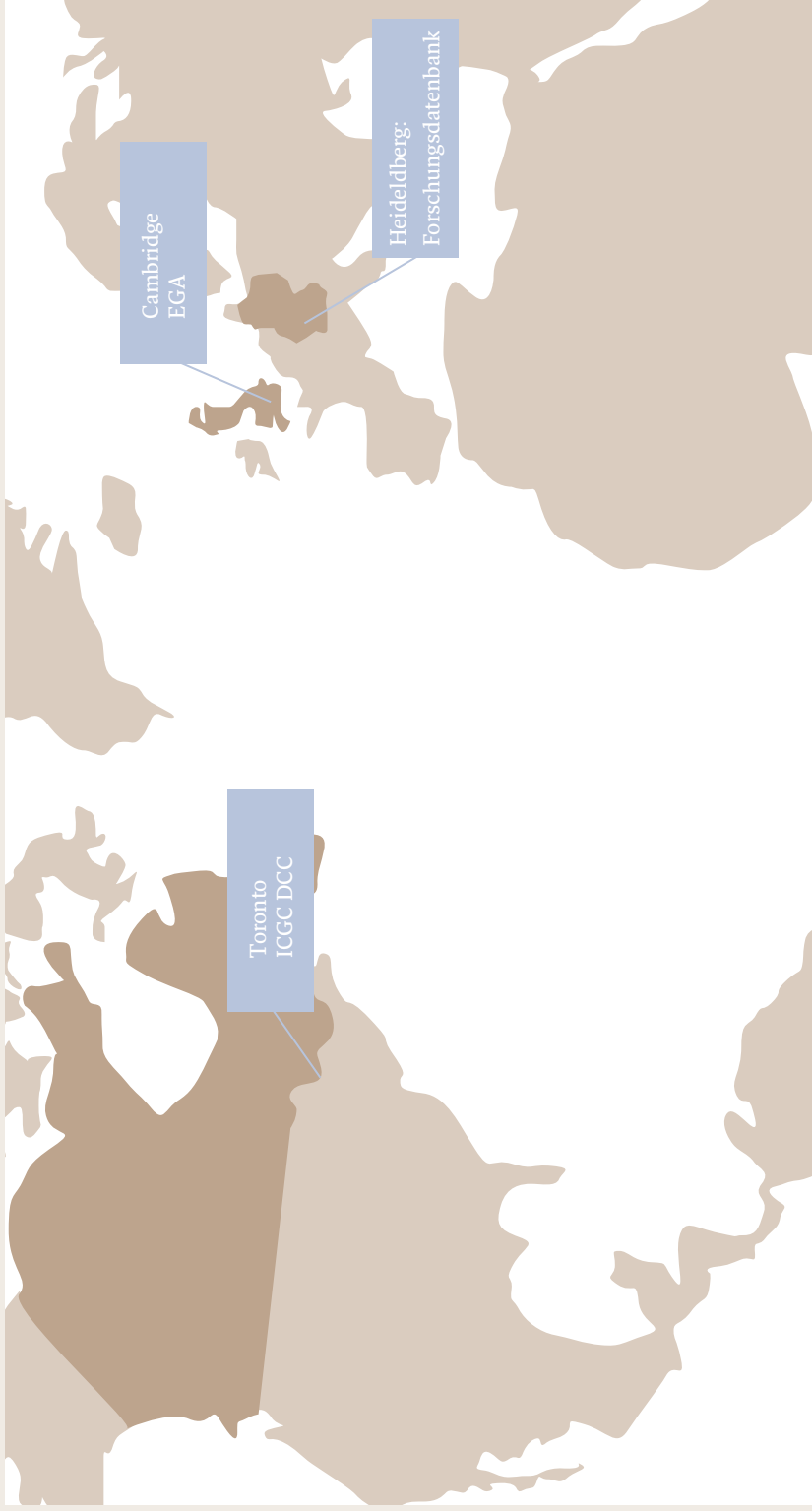
Beispiel für einen internationalen Datenaustausch: Heidelberg im International Cancer Genome Consortium (ICGC)