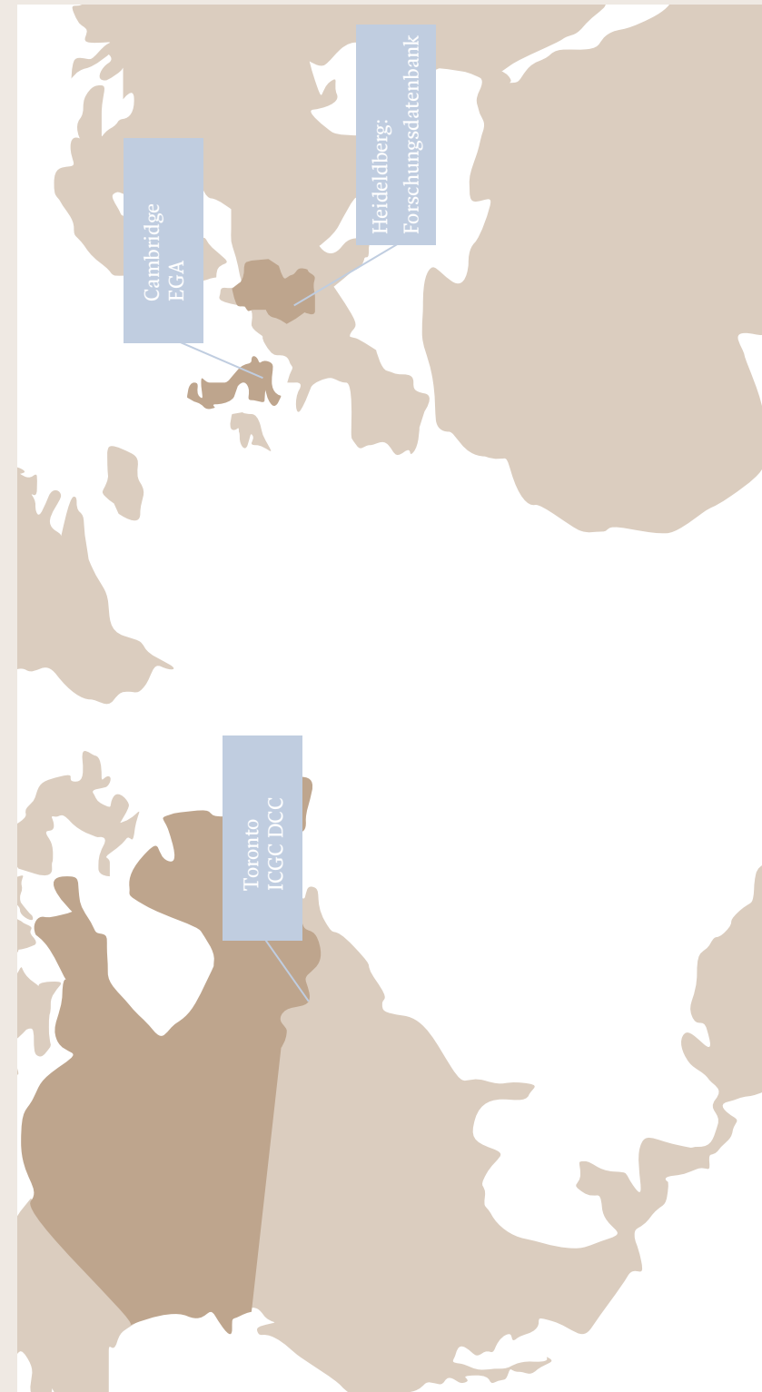
Beispiel für einen internationalen Datenaustausch: Heidelberg im International Cancer Genome Consortium (ICGC)

Daten können bestmöglich durch eine Anonymisierung geschützt werden, sofern nirgends sonst ein Bezug zwischen den genetischen Daten einer Person und ihren persönlichen Daten (z.B. Name) besteht. Allerdings würde ein bestmöglicher Datenschutz in Form der Anonymisierung in der Forschung die Rückverfolgbarkeit des Patienten oder Probanden verhindern. Eine Befundmitteilung medizinisch relevanter Ergebnisse wäre dann unmöglich. Bei Langzeitstudien wird die Möglichkeit der Re-Identifizierung in der Regel erforderlich sein, um Daten, die nach längerer Zeit zusätzlich erhoben werden, den ursprünglichen Daten richtig zuordnen zu können. Einen Kompromiss stellt die Pseudonymisierung dar – das Ersetzen des Namens und anderer Identifikationsmerkmale durch ein Kennzeichen zu dem Zweck, die Bestimmung des Betroffenen auszuschließen (§ 3 Abs. 6a BDSG). Wenn Daten den klinischen Kontext verlassen, müssen sie zuvor pseudonymisiert werden. Bei der Pseudonymisierung von Daten, die zu Forschungszwecken verwendet werden, muss unter Beachtung der Persönlichkeitsrechte des Patienten oder Probanden geregelt werden, in welchen Fällen die Re-Identifizierung von Genom-Daten durch einen Treuhänder (Keyholder) vorgenommen werden kann. Entscheidend sind die Schnittstellen zwischen Klinik und Forschung, an denen die Umwandlung von personenbezogenen Daten in pseudonymisierte Datensätze erfolgt. Aus der