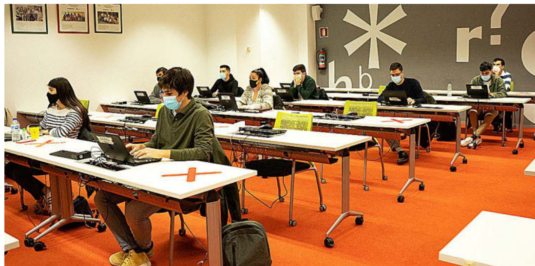
ESCUELA DE UNIDAD EDITORIAL

Un mañana que siempre termina llegando: cerca de 3.000 alumnos han pasado por las aulas del centro de formación más importante de España asociado a un gran grupo de comunicación. En el próximo curso, serán siete los másteres que la Escuela de Unidad Editorial ofertará. Un continuo crecimiento de la rama educativa, cada vez más especializada y adaptada a las necesidades actuales del periodismo, y en especial de las cabeceras de Unidad Editorial: EL MUNDO, MARCA, EXPANSIÓN y TELVA. Así, se ha diseñado un plan didáctico que gira en torno a la práctica profesional como elemento fun-