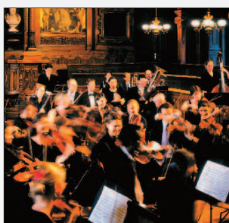
Konzert in der Aula der Alten Universität

Wer die Ruperto Carola in all ihren Facetten in Forschung, Lehre und Verwaltung kennenlernen möchte, kommt an einem Besuch der Universitätsmeile am Samstag, 25. Juni 2011 , nicht vorbei. Zwischen Neuer Universität und Marstall werden Tore und Türen aller Universitätsgebäude geöffnet sein. Mit einbezogen sind auch zahlreiche Höfe und Plätze in diesem Bereich, so beispielsweise der Barockgarten zwischen Jesuitenkirche, Romanischem und Anglistischem Seminar oder auch die Innenhöfe der Universitätsbibliothek und des Musikwissenschaftlichen Seminars. Angeboten wird ein abwechslungsreiches und unterhaltsames Rahmenprogramm. Alle Bereiche der Universität – ob in Bergheim, im Neuenheimer Feld oder in der Altstadt angesiedelt – sind beteiligt. Nicht nur unsere Gäste, sondern sicherlich auch viele Universitätsmitglieder werden überrascht sein, über welche schöne Orte unsere Universität im Bereich dieser Festmeile verfügt.