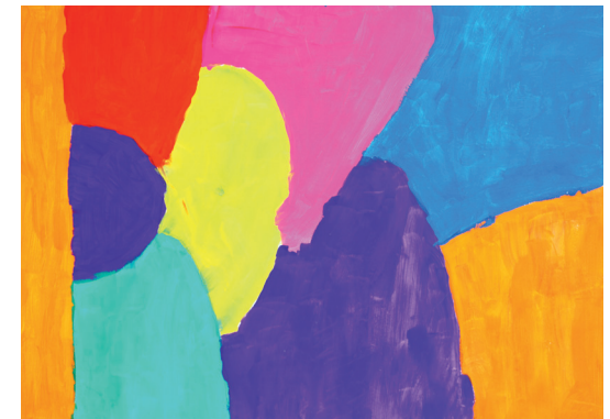
Celina „ohne Titel“, Gouache 42 x 60 cm

Bei den Jugendlichen ging es kunsttheoretisch zu. Anhand von Bildbetrachtungen wurde die kunsthistorische Entwicklung des 20. Jahrhunderts betrachtet - begonnen beim Realismus über Impressionismus und Expressionismus bis hin zum Abstrakten Expressionismus. Anhand aktueller Künstler und deren Arbeiten lag der Schwerpunkt schließlich auf zeitgenössischer Malerei. Inspiriert von dieser konnte sich jeder Teilnehmer der eigenen freien malerischen Arbeit widmen.