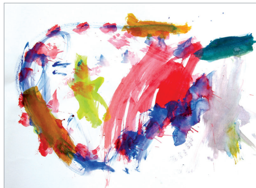
Baran „ohne Titel“, Aquarellfarbe 42 x 60 cm

In der Kindergruppe drehte sich alles um künstlerische Experimente. Neben dem Ausprobieren von Farbmischung und dem Ermischen eines eigenen Farbkreises, gab es jede Menge Raum für freie malerische Arbeit. Aus der Experimentierfreude heraus konnte jedes Kind ein eigenes bildnerisches Thema entwickeln. Das besondere Interesse der Kinder galt dabei der „Wahren Geschichte von allen Farben“.