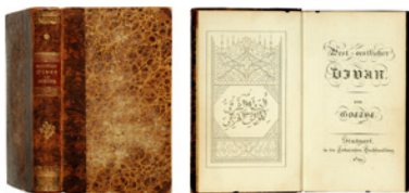
Johann Wolfgang von Goethe: West-östlicher Divan. Stuttgart, in der Cotta'schen Buchhandlung 1819, Erstdruck