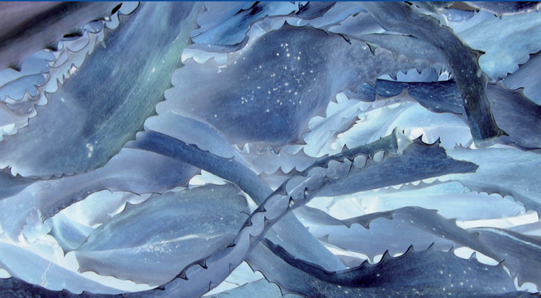
„monochrome“ V, 2009