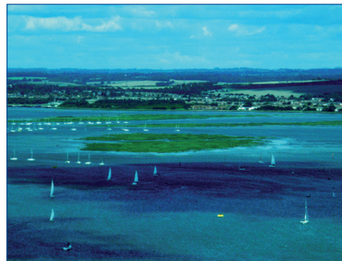
„Seascape“, Portsmouth 2010

Schließlich sind auch Bilder aus der Serie „monochrome“ aus dem Jahr 2009 zu betrach-ten, nach der die Ausstellung am ZI benannt wurde. Die Fotografien hierzu entstanden im Bo-tanischen Garten Berlin-Dahlem und konzentrie-ren sich auf das Zusammenspiel von verschie- denen Farben und Strukturen von Pflanzen.