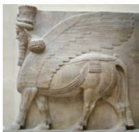
Sterkoloss, der als Türhüter in einem assyrischen Palast in Dur-Scharukin (heute Hursabad in Nordirak) stand. Heutiger Standort: Musée du Louvre, Paris