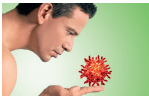
Titelmotiv der Ausstellung MenschMikrobe