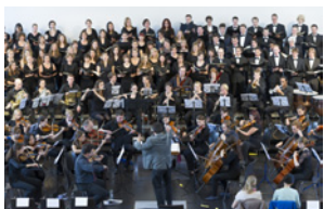
Universitätsorchester und -chor »Collegium Musicum«