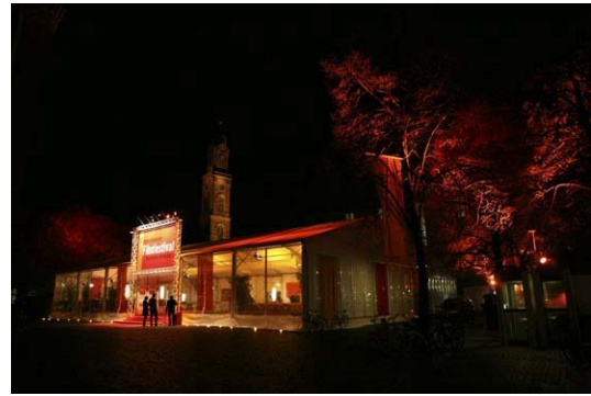
Festivalzelt des internationalen Filmfestivals

Mehr Informationen: www.schloss-heidelberg.de