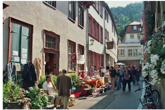
„Heidelberger Herbst“: Flohmarkt in der Altstadt

Mehr Informationen: www.heidelberg-marketing.de