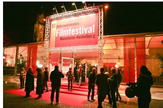
Filmfestival auf dem Universitätsplatz

Das internationale Filmfestival Mannheim-Heidelberg ist das sechstälteste internationale Filmfestival der Welt (nach Venedig, Cannes, Berlin, Locarno, Karlovy Vary). Es widmet sich der Entdeckung neuer internationaler Talente und zeigt nur Filme, die noch auf keinem anderen