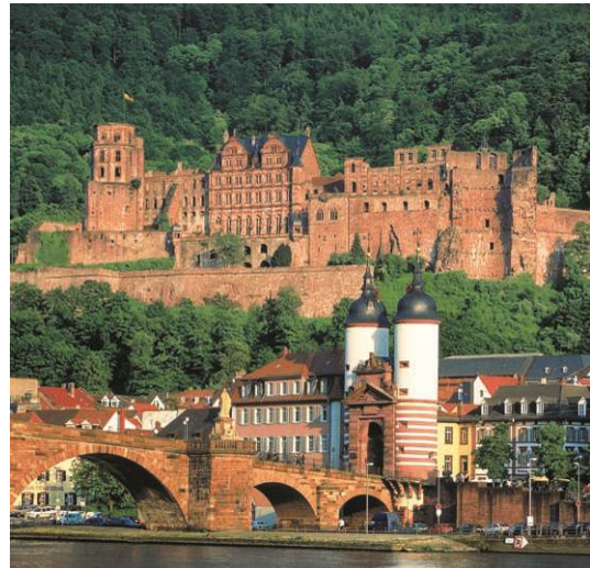
Festspiele im romantischen Heidelberger Schloss

ARTORT 2012 im Campus Neuenheimer Feld unter dem Motto "Feldversuche". Von der Bühne in den öffentlichen Raum: Unter dem Namen "ARTORT" inszeniert das UnterwegsTheater mit internationalen Künstlern den öffentlichen Raum