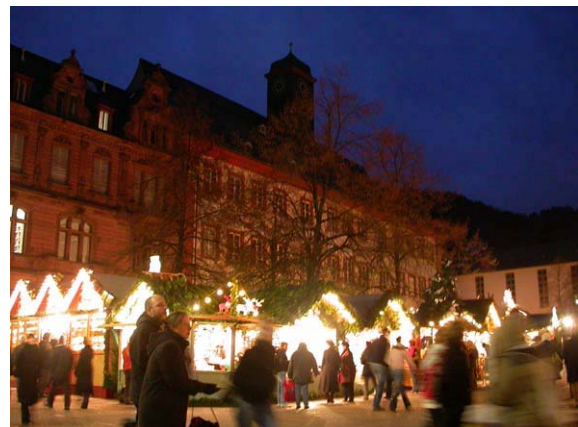
Weihnachtsmarkt am Universitätsplatz