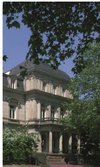
Das Deutsch-Amerikanische Institut (DAI) in Heidelberg

Als einer der ältesten Think Tanks der Region ist das Deutsch-Amerikanische Institut Anlaufstelle für brillante Denker und für jeden, der eine der zahlreichen interkulturellen Dienstleistungen in Anspruch nehmen möchte. Der angegliederte internationale Kindergarten, die Sprachschule und die öffentliche Bibliothek vervollständigen den ganzheitlichen Ansatz zur Förderung des transatlantischen Dialogs. Mehr Informationen www.dai-heidelberg.de