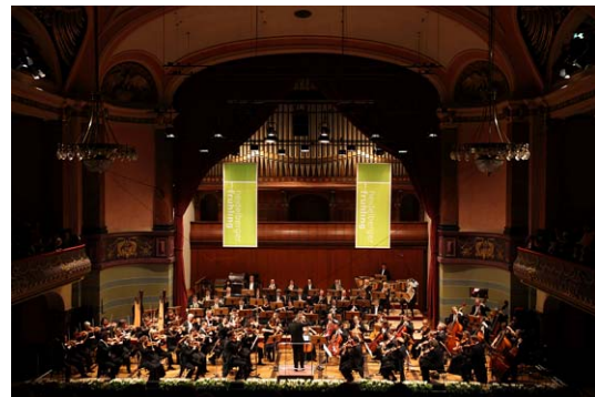
„Heidelberger Frühling“ in der Stadthalle aus der Gründerzeit