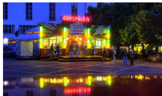
Literaturtage auf dem Universitätsplatz