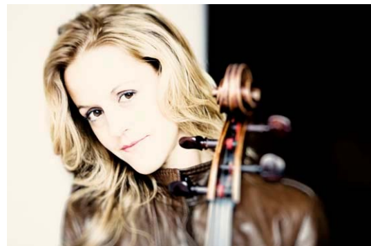
Die Cellistin Sol Gabetta kommt zum „Heidelberger Frühling“