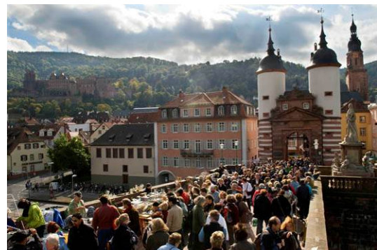
Altstadtfest „Heidelberger Herbst“

Das Altstadtfest „Heidelberger Herbst“ ist facettenreich. Mittelaltermarkt, Kunsthandwerkermarkt, Flohmarkt und Stände mit regionalen Spezialitäten laden zum Bummeln und Probieren ein. Ausgebaut wurden in den letzten Jahren das Kulturprogramm mit Theater, Malkunst, Poetry Slam und Lesungen.