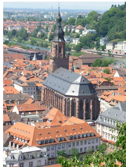
In der Heiliggeistkirche finden jedes Jahr mehr als 200 Konzerte mit über 10.000 Zuhörern statt

Am 27. Juli 2012 endet das Musikfestival mit einem nächtlichen Orgelkonzert (Beginn 23.00 Uhr) – ein besonders ergreifender Moment, wenn an Bachs Todestag kurz nach Mitternacht der letzte Ton in der Heiliggeistkirche verklungen ist. Mehr Informationen: www.studentenkantorei.de