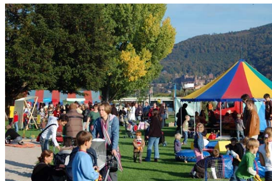
Theaterzelt auf der Neckarwiese