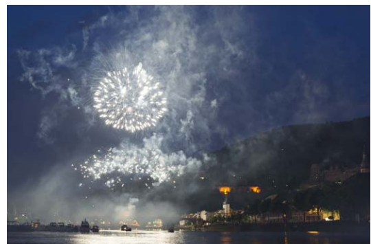
Mondexplosion und Lichtermeer