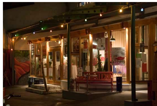
„schöner lügen“: Abende im Kulturfenster

Heidelberg Marketing GmbH Steffen Schmid Ziegelhäuser Landstr. 3 D-69120 Heidelberg Tel +49(0)6221 – 14 22 20 Fax +49(0)6221 – 14 22 22 schmid@heidelberg-marketing.de www.heidelberg-marketing.de