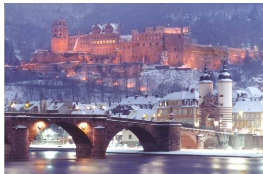
Winterzauber in Heidelberg