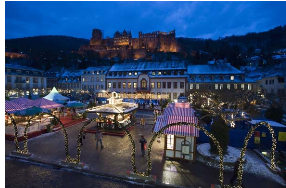
Romantische Eisbahn am Karlsplatz in den Abendstunden

Mehr Informationen: www.heidelberg-marketing.de