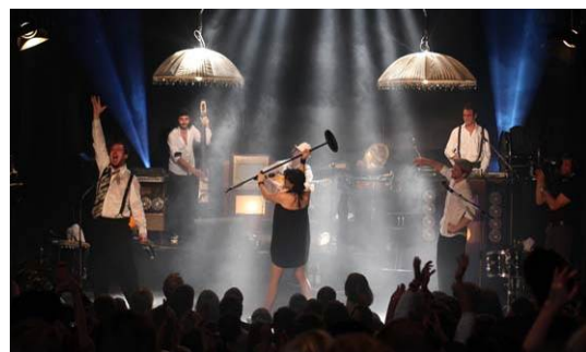
Caravan Palace auf dem Enjoy Jazz-Festival