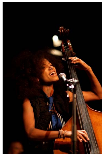
Enjoy Jazz 2012: Esperanza Spalding