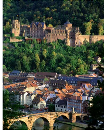
“Man glaubt, Heidelberg sei bei Tag die äußerste Steigerung der Schönheit,

Ein Höhepunkt des Kulturjahres 2012: Im Herbst 2012 wird das sanierte, um einen zweiten Zuschauersaal erweiterte Theater im Zentrum der Altstadt nach zwei Jahren Bauzeit und einem Investitionsvolumen von 60 Millionen Euro rechtzeitig zur Spielzeiteröffnung 2012/2013 eingeweiht. Stolz und dankbar ist man in Heidelberg für das großartige bürgerschaftliche Engagement rund um die Sanierung: mehr als 16 Millionen Euro an privaten und unternehmerischen Spenden fließen in das größte Heidelberger Hochbauprojekt der letzten Jahre, wodurch den Bürgern der Stadt und ihren Gästen