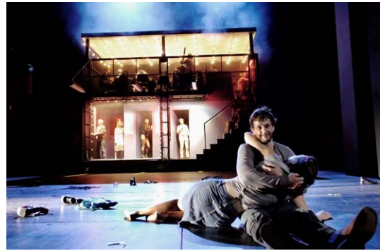
Drama Woyzeck von Robert Wilson / Tom Waits / Kathleen Brennan, aufgeführt beim Heidelberger Stückemarkt 2009

Das Literaturfestival gehört seit 1994 zu den Höhepunkten des kulturellen Lebens in Heidelberg. Das Programm besteht aus Lesungen internationaler Schriftstellerinnen und Schriftsteller, Autorengesprächen und Musik. Der Veranstalter, die Arbeitsgemeinschaft der Heidelberger Literaturtage, setzt bei der