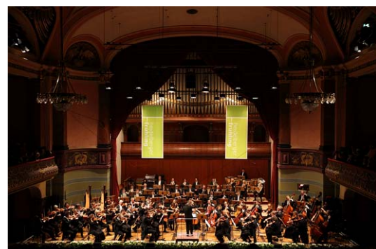
„Heidelberger Frühling“ in der Stadthalle aus der Gründerzeit