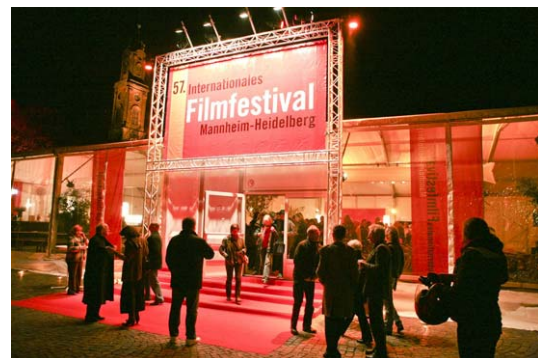
Filmfestival auf dem Universitätsplatz

Eröffnungskonzert mit Charles Lloyd auf dem Heidelberger Schloss 2009