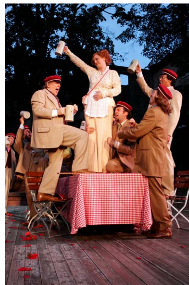
Operette: Der Studentenprinz Heidelberger Schlossfestspiele