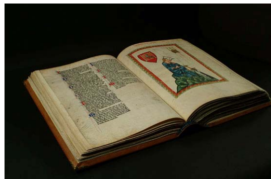
Der kostbare Schatz deutscher Geschichte: Codex Manesse