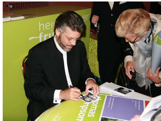
Nach den „Frühlingskonzerten“ mischen sich die Künstler gern unter das Publikum – hier der Star-Bariton Thomas Hampson.