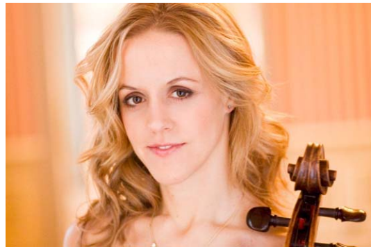
Die argentinische Cellistin Sol Gabetta kommt zusammen mit dem Kammerorchester Basel zum „Heidelberger Frühling“

Gastland des 27. Heidelberger Stückemarkt ist