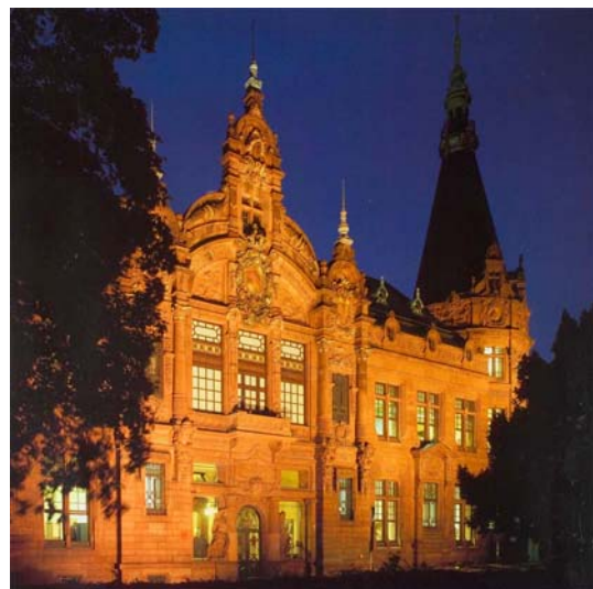
Renaissancefassade der Universitätsbibliothek Codex Manesse Ausstellung: 1.11.2010 – 20.02.2011