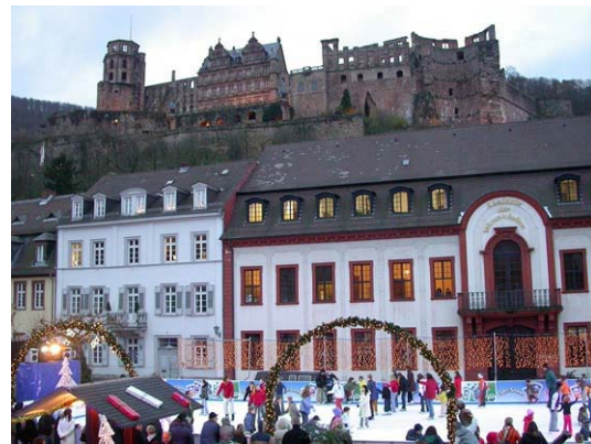
Eisbahn vor romantischer Kulisse