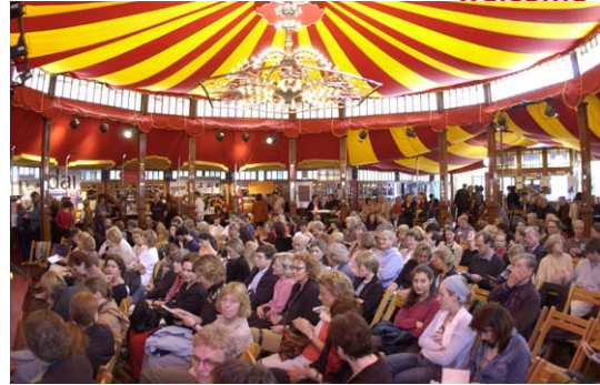
Besucher im Jugendstilzelt der Literatortage

Veranstalter, die Arbeitsgemeinschaft der Heidelberger Literatortage, setzt bei der Zusammenstellung auf Vielfalt: Neben renommierten Autoren werden junge Talente eingeladen - großer Wert wird dabei auf eine internationale Auswahl gelegt. Gefördert werden außerdem ganz junge Talente, mit Lesungen für Kinder und Jugendliche und einer Schreibwerkstatt.