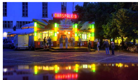
Literaturtage auf dem Universitätsplatz