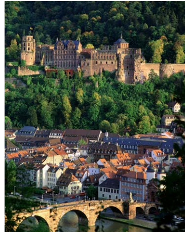
“Man glaubt, Heidelberg sei bei Tag die äußerste Steigerung der Schönheit,

Alljährlich um 17.00 Uhr am letzten Mittwoch im November macht das Christkind eine Stippvisite in Heidelberg und eröffnet am Marktplatz feierlich den Weihnachtsmarkt. Bis zum 22. Dezember