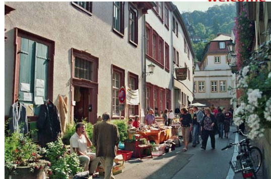
„Heidelberger Herbst“: Flohmarkt in der Altstadt

Heidelberg Marketing GmbH Steffen Schmid Ziegelhäuser Landstr. 3 D-69120 Heidelberg Tel +49(0)6221 – 14 22 20 Fax +49(0)6221 – 14 22 22 schmid@heidelberg-marketing.de www.heidelberg-marketing.de