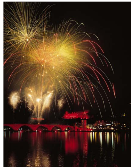
Schlossbeleuchtung mit Feuerwerk

Das Literaturfestival gehört seit 1994 zu den Höhepunkten des kulturellen Lebens in Heidelberg. Das Programm besteht aus Lesungen internationaler Schriftstellerinnen und Schriftsteller, Autorengesprächen und Musik. Der