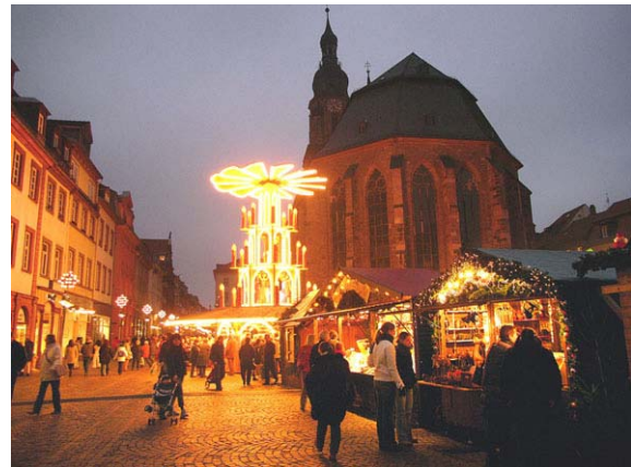
Das Wahrzeichen des Weihnachtsmarkts: Die Weihnachtspyramide mit Figuren aus der Stadtgeschichte

Zum 14. Mal lockt das Internationale Musikfestival „Heidelberger Frühling“ vom 20. März bis 24. April 2010 zu rund 80 mit großen Namen wie Thomas Hampson, Sol Gabetta und das City of Birmingham Symphony Orchestra unter Shooting-Star Andris Nelsons. Klavierfans können sich unter anderem auf Hélène Grimaud, Ivo Pogorelich, Grigory Sokolov und einen Vortrag von Alfred Brendel freuen. Auch der erste „Artist in Residence“ ist eine Pianistin: ECHO-Klassik-