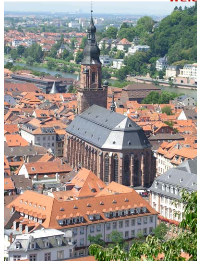
In der Heiliggeistkirche finden jedes Jahr mehr als 200 Konzerte mit über 10.000 Zuhörern statt

Das Altstadtfest „Heidelberger Herbst“ ist facettenreich. Mittelaltermarkt, Kunsthandwerkermarkt, Flohmarkt und Stände mit regionalen Spezialitäten laden zum Bummeln und Probieren ein. Ausgebaut wurden in den letzten Jahren die „Kulturmeile“, mit Theaterprogramm, Malkunst, Poetry Slam und Lesungen. Musikalische Unterhaltung unterschiedlichster Art findet sich auf beinahe allen öffentlichen Plätzen. Die großen Bühnen beginnen bereits um 11.00