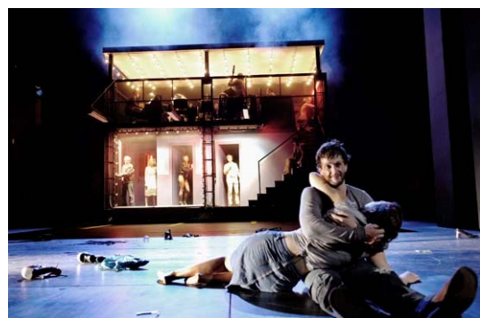
Drama Woyzeck von Robert Wilson / Tom Waits / Kathleen Brennan, aufgeführt beim Heidelberger Stückemarkt 2009