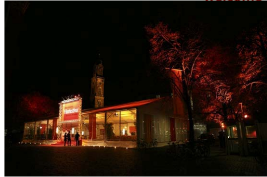
Festivalzelt des internationalen Filmfestivals

Heute berühmte Regisseure wie Francois Truffaut, Wim Wenders, Rainer Werner Fassbinder, Krzysztof Kieslowski, Jim Jarmusch, Lars von Trier, Bryan Singer und Thomas Vinterberg zeigten ihre ersten Filme in Mannheim und Heidelberg. Mehr Informationen: www.iffmh.de