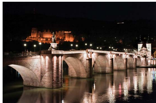
aber wenn man Heidelberg bei Nacht sieht . . .” Mark Twain: A Tramp Abroad, 1878.