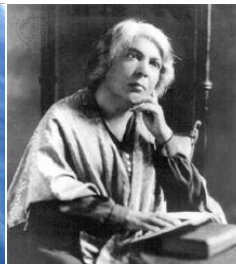
Grazia Deledda (1871 – 1936)