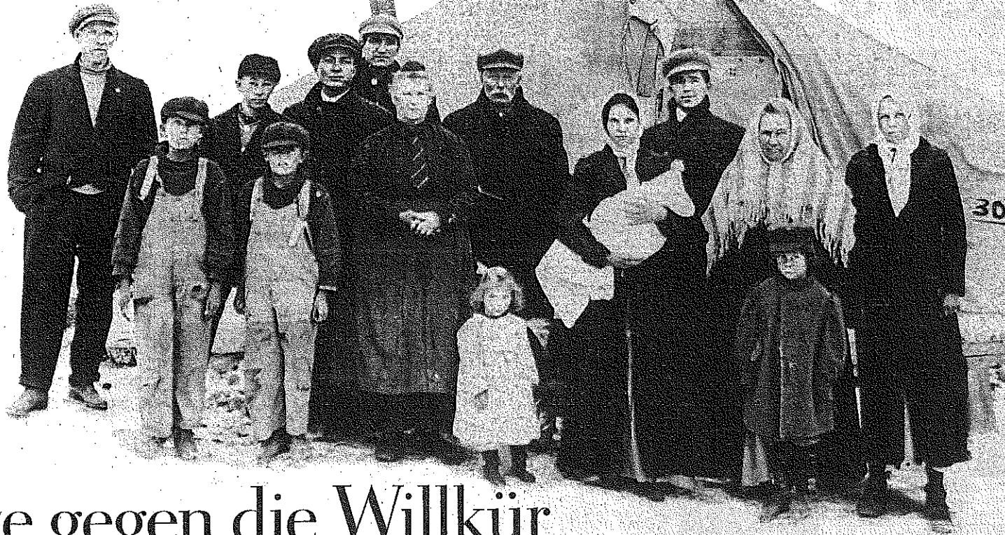
Überwintern in unwirtlichen Zeiten: Streikende Bergleute mit ihren Familien in Colorado