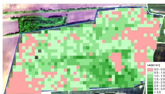
Abbildung 4. LAI aus spektral und geometrisch simulierten HSI Bilddaten.

Analog wurde eine Modellierung der LAI-Werte für die auf 30m resampelten Bilddaten (räumliche Auflösung des HSI-Sensors) durchgeführt (Abb. 4).