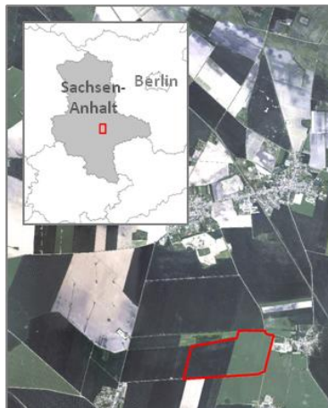
Abbildung 1. Weizenschlag im Untersuchungsgebiet bei Köthen.

Der untersuchte Weizenschlag hat eine Größe von 80 ha und befindet sich nordwestlich der Stadt Köthen in Sachsen-Anhalt ( 51^{\circ}47.62 N; 11^{\circ}54.9 E) (Abb.1). Aufgrund der Lage des Untersuchungsgebietes im Regenschatten des Harzes beträgt die jährliche Niederschlagssumme lediglich 430mm. Damit ist die Region ein Teil des mitteldeutschen Trockengebietes, mit einer jährlichen Durchschnittstemperatur von 9^{\circ}\text{C} . Schwarzerden sind der bodenlandschaftlich bestimmende Bodentyp im Untersuchungsgebiet.