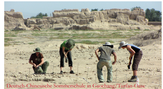
Deutsch-Chinesische Sommerschule in Gaochang/Turfan-Oase