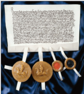
Gründungsurkunde der Universität (Replik)