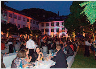
Ruperto-Carola- Sommernacht 2008